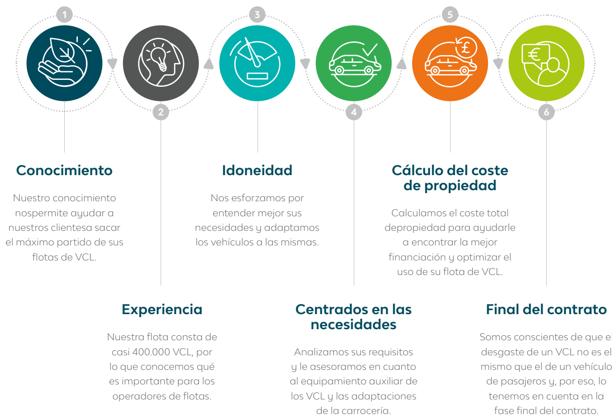
Figura 2: Cómo apoya LeasePlan a los operadores de flotas de vehículos comerciales ligeros.

Los VCL constituyen el 23 % de la flota de LeasePlan y entendemos que el mercado de este tipo de vehículos es intrínsecamente distinto al mercado tradicional de vehículos utilitarios de alquiler. En este sentido, la propuesta de VCL de LeasePlan se basa en un conocimiento detallado y una comprensión profunda de las necesidades de los operadores de flotas de VCL, como por ejemplo configuraciones personalizadas o el cumplimiento de la legislación local. Es este conocimiento lo que nos permite crear la propuesta adecuada y comercializarla digitalmente a través de nuestras plataformas de Internet.